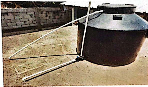
Foto1: Reparación de tubería agua potable y sistema