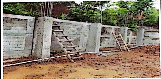
Foto 6: Tallado de muro de contención, para evitar deslave por lluvia.

Observación: Si es necesario se pueden agregar hojas adicionales y adjuntar el mismo número de hojas.