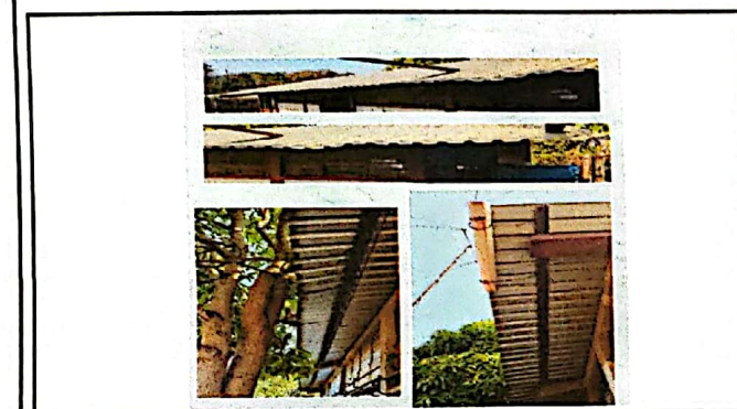
Foto3: Canales y bajadas