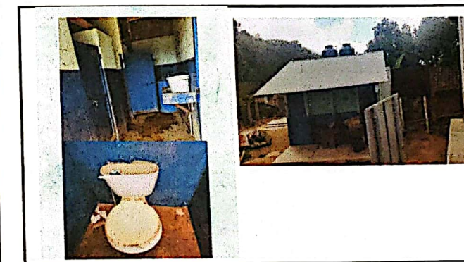
Foto: 6 Servicios sanitarios y sus accesorios

Observación: Si es necesario se pueden agregar hojas adicionales y actualizar el número de fotos.