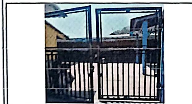
Foto: 5 Se observa portón en mal estado.