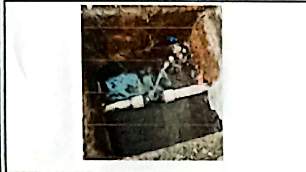
Foto1: Se observa llave de paso de agua entubada inservible.