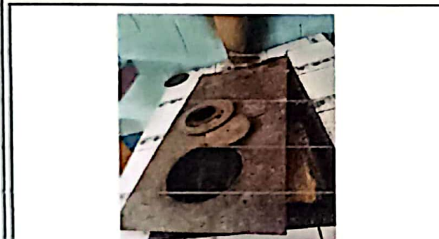
Foto3: Se observa plancha en mal estado.