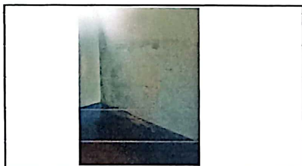
Foto: 6 Se evidencia pared en mal estado debido a la humedad.

Observación: Si es necesario se pueden agregar fotos adicionales y actualizar el número de hojas.