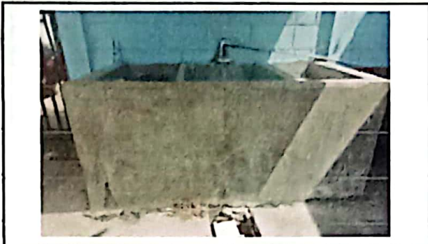
FOTO 2: Se observa tanque de agua en mal estado y con fugas de agua.