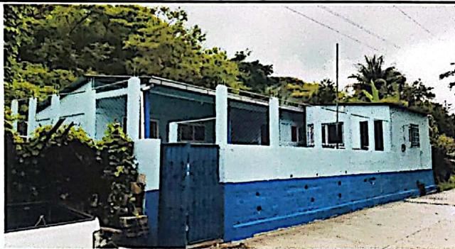
Foto: 5 REPARACIÓN DE MURO PERIMETRAL