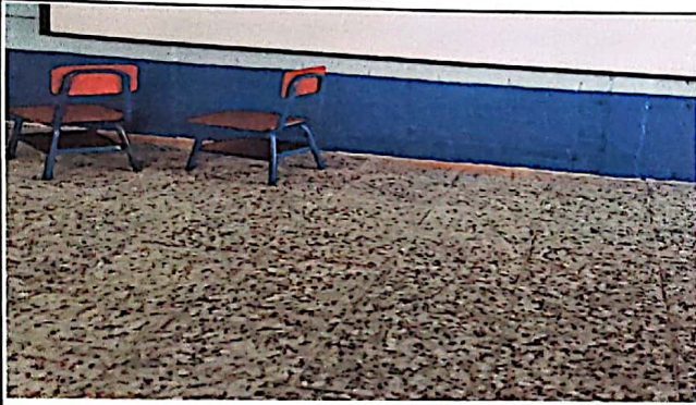
Foto3: CAMBIO DE PISO