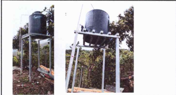
Foto 7: MANTENIMIENTO DE TINACO MEDIANTE NUEVO KIT DE ACCESORIOS PARA VOLVERLO A QUE SEA FUNCIONAL