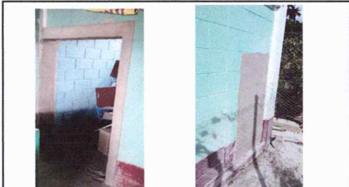
Foto 9: FUNDICION DE COLUMNA, MOCHETA Y TALLADO DE MARCOS DE PUERTA Y AREAS EXTERIORES.