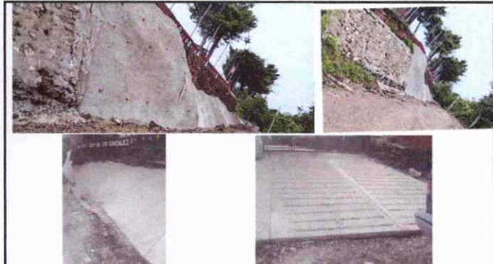
Foto 10: REBESTIMIENTO DE CONCRETO EN TALUD CON ELECTROMALLA Y ENSABIETADO A LA SUPERFICIE DEL TERRENO NATURAL.