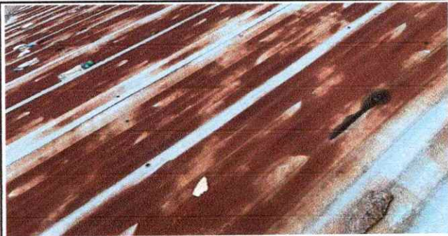
Foto1: SUSTITUCIÓN DE LAMINA