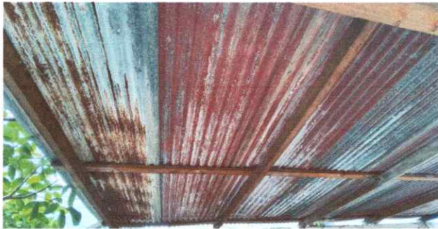
Foto1: SUSTITUCIÓN DE LAMINA