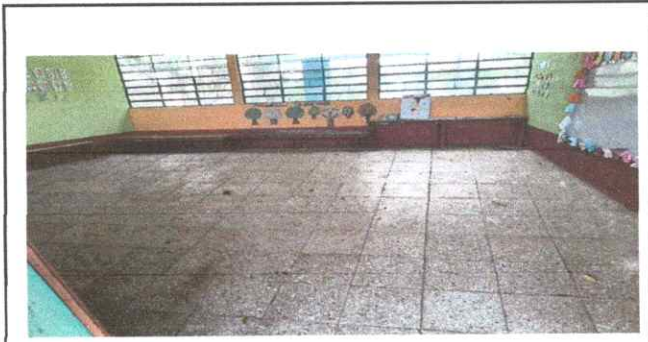
Foto1: SUSTITUCIÓN PISO GRANITO AULA 1