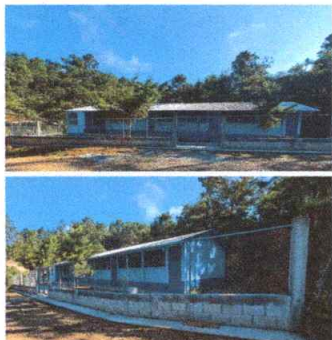
Foto1: muro reparado