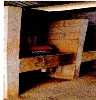
Foto 2: AREA DE LAVADO DE MANOS SIN FUNCION, TUBERIA EN MAL ESTADO