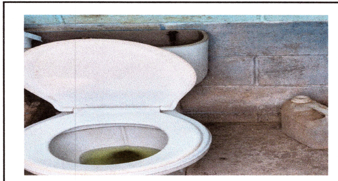
Foto 4: Desmontaje, suministro e instalación de accesorios inodoro (contra llave, tubo de abasto y kit de tanque)