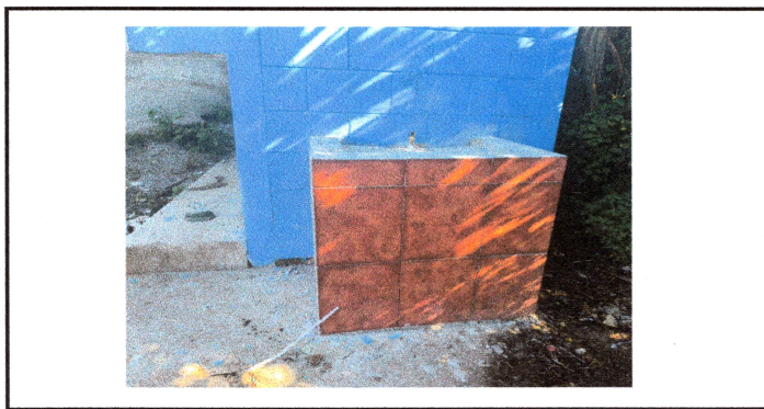
Foto 5: Mejoramiento de lavamanos con plancha de concreto reforzado con azulejo (incluye accesorios)