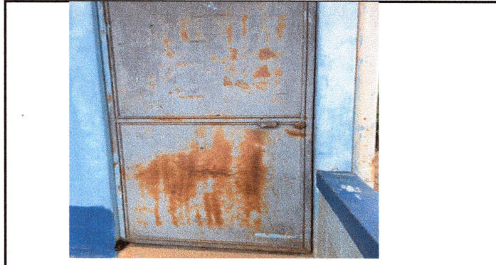
Foto 2: Mantenimiento a puerta de metal lijado, cepillado, sujeciones, aplicación de 2 manos (de pintura anticorrosiva) 3.30*1.00