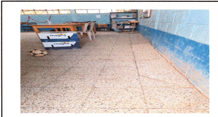
Foto 3: Suministro e instalación de piso de granito dañado en aulas.