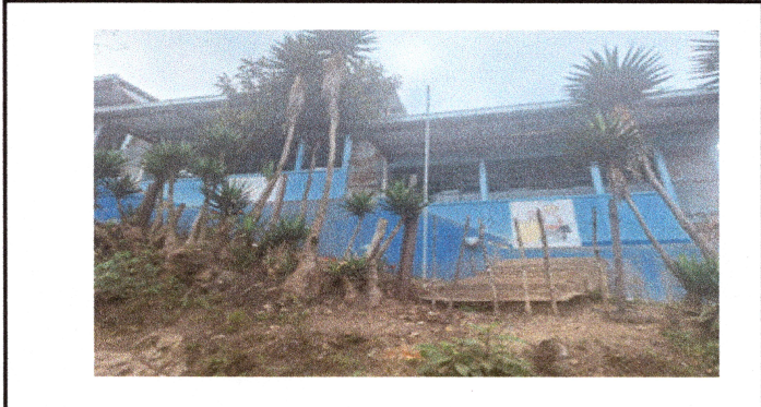
Foto1: Mantenimiento de rejas 32.50 x 1.50