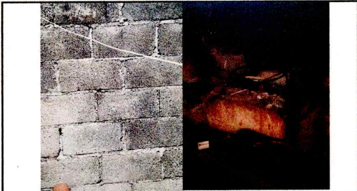
Foto1: Es necesario la reparación de la cocina.