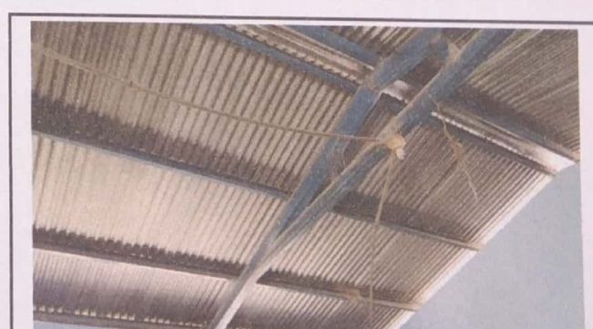
Foto: 6 Se observa el cableado inservible para su uso

Observación: Si es necesario se pueden agregar hojas adicionales y actualizar el número de hojas.