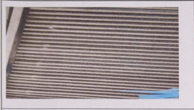
Foto1: Se observan agujeros en la lámina