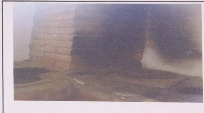
Foto4: Se observa plancha y comal en mal estado