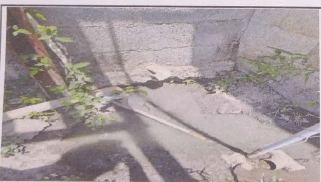
Foto 5 Se observa el drenaje en mal estado