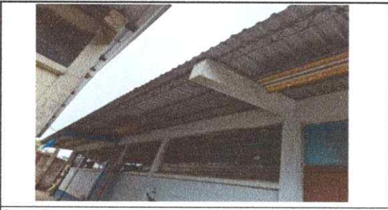
Foto 5: Se necesita poner canales para y bajadas de agua pluvial para evitar futuros daños en el edificio escolar.