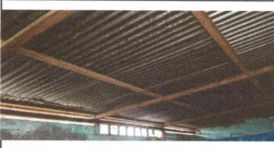
Foto 3: La estructura del techo con ceunta el aula actualmente es de madera la cual ya se encuentra en mal estado.