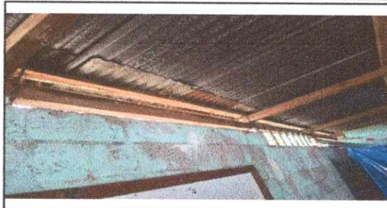
Foto 2: Actualmente el aula cuenta con cubierta de lámina acanalada la cual ya se encuentra en mal estado.