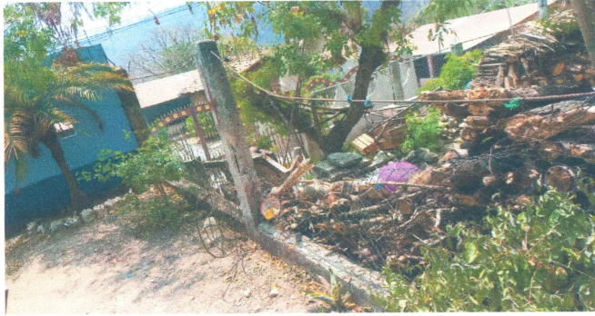
Foto1: Reparación y levantamiento de muro perimetral.