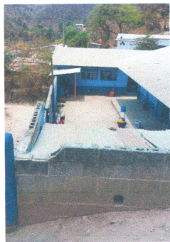
Foto: 5 continuación de suministro e instalación de lamina Troquelada calibre 26.