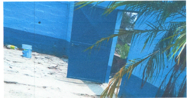
Foto: 6 Reparación de Loza de patio exterior.

Observación: Si es necesario se pueden agregar hojas adicionales y actualizar el número de hojas.