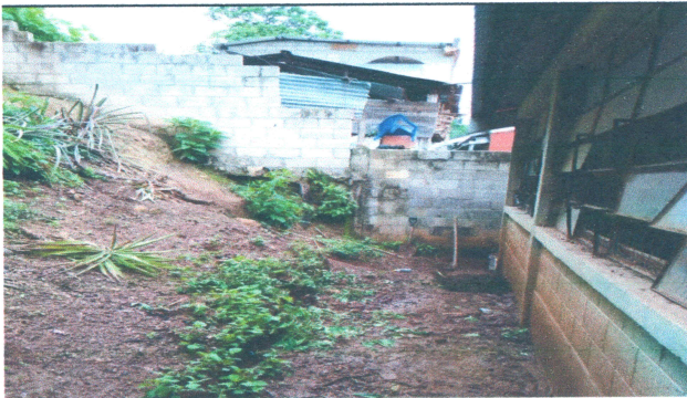
Foto3: Reparación de muro de contención.