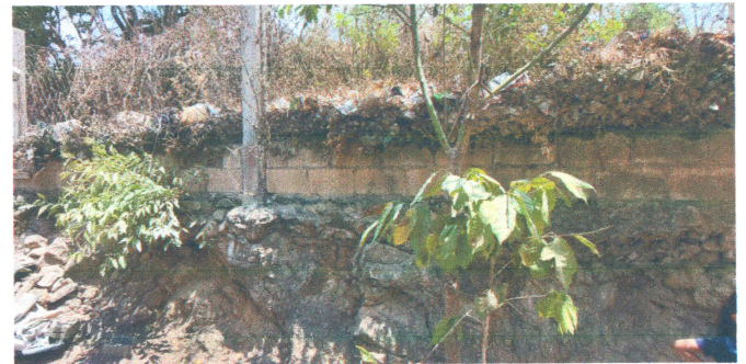
Foto4: Reparación y reforzamiento de muro perimetral.