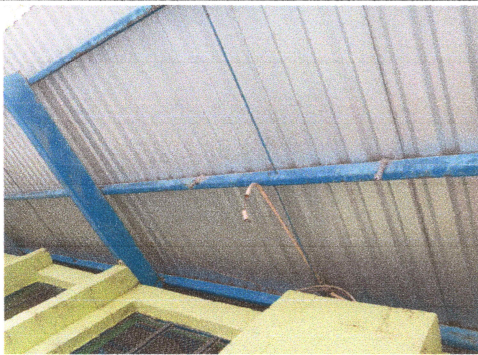
Foto: 5 AREA A TRABAJAR REPARACION SISTEMA ELECTRICO