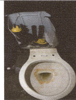
Foto: 6 AREA A TRABAJAR SERVICIOS SANITARIOS Y ACCESORIOS

Observación: Si es necesario se pueden agregar hojas adicionales y actualizar el número de hojas.