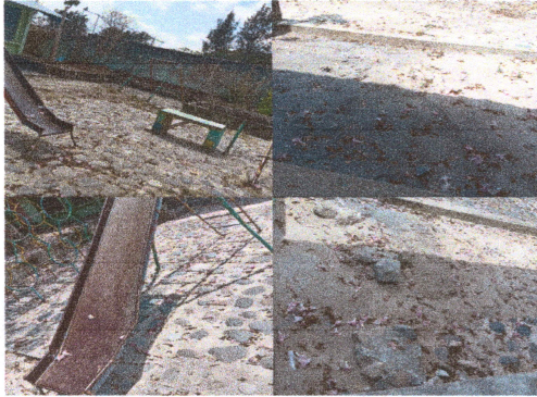
Foto1: AREA A TRABAJAR PATIO Y AREA DE JUEGOS