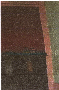
Foto3: AREA A TRABAJAR PILA