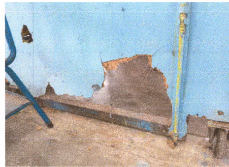
Foto4: AREA A TRABAJAR PORTON DE DIVISION