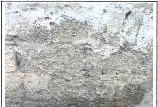
Foto 12: Reparación de repello y cernido de paredes (Sustrucción).

Observación: Si es necesario se pueden agregar hojas adicionales y actualizar el número de hojas.