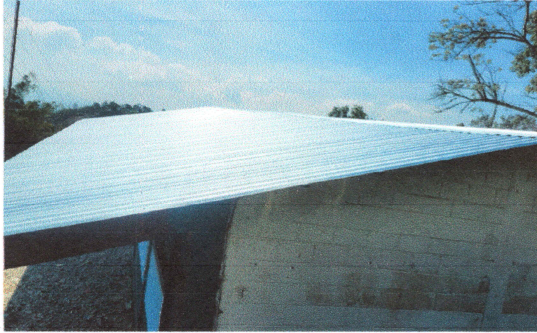
Foto1: techo finalizado