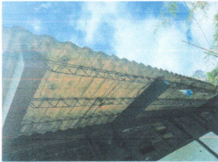
Foto1: SUMINISTRO E INSTALACIÓN DE LÁMINA TROQUELADA CALIBRE 26 Y REFORZAMIENTO DE ESTRUCTURA METALICA Y PINTURA