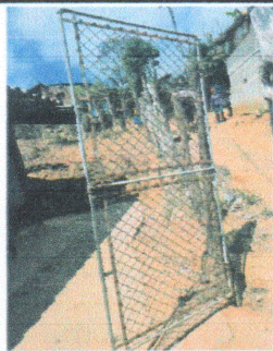
Foto3: REMOZAMIENTO EN MURO PERIMETRAL