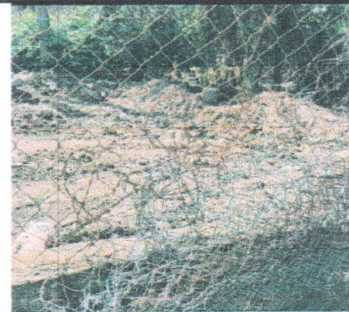
Foto: 6 REMOZAMIENTO EN MURO PERIMETRAL CON MAYA

Observación: Si es necesario se pueden agregar hojas adicionales y actualizar el número de hojas.