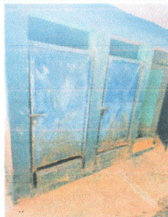
Foto: 5 REMOZAMIENTO DE PUERTAS