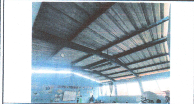
Foto1: SUMINISTRO E INSTALACIÓN DE LAMINA TROQUELADA CALIBRE 26