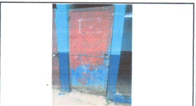
Foto4: REPARACIÓN DE PUERTAS