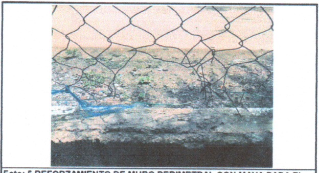
Foto: 5 REFORZAMIENTO DE MURO PERIMETRAL CON MAYA PARA EL AREA DE PARVULOS