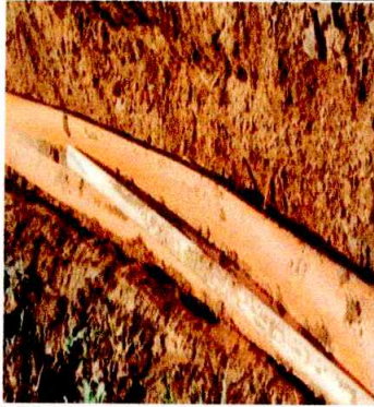
Foto 1: SE APRECIA EL MAL ESTADO DE LA RED DE DRENAJE (SUSTITUCIÓN)