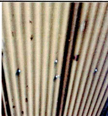
Foto 1: SE APRECIA EL ESTADO DE LA CUBIERTA DE LAMINA (SUSTITUCIÓN)