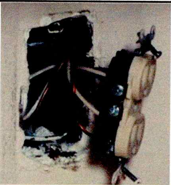
Foto 3: SE OBSERVA CABLEADO ELECTRICO EN MAL ESTADO (SUSTITUCIÓN)