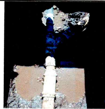
Foto 2: ES NECESARIO CAMBIO DE TUBERIA DE AGUA POTABLE (SUSTITUCIÓN)