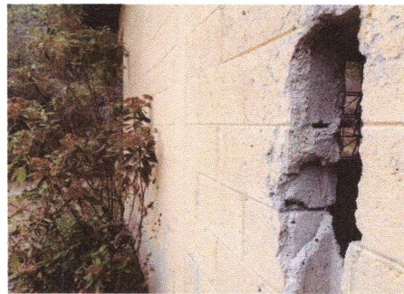
Foto4: Reparación de paredes de cocina