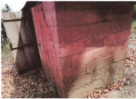
Reemplazo de puerta para baños