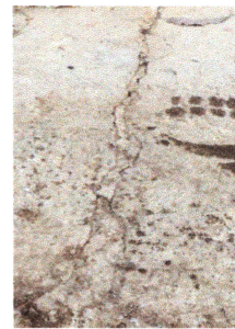
Foto: 6 Reparación de mesa de concreto

Observación: Si es necesario se pueden agregar hojas adicionales y actualizar el número de hojas.