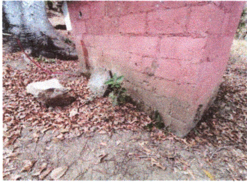
Foto1: Reparación de base para piso