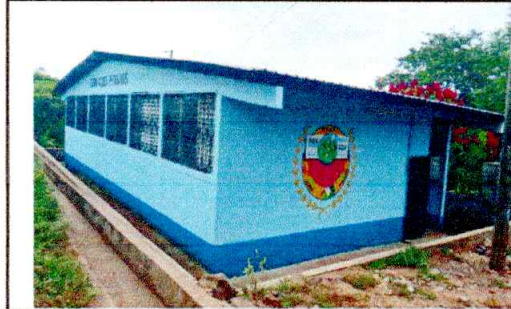
Foto 2: SE OBSERVA AULAS SIN PROTECCION SE PONDRÁ MURO PERIMETRAL