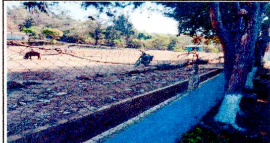
Foto 3: SE OBSERVA DAÑADO EL MURO PERIMETRAL SE CAMBIARÁ MALLA Y SE PONDRÁ TUBU GALVANIZADO