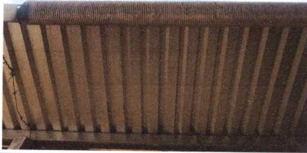
Foto7: Canales en mal estado.