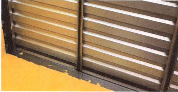
Foto1: Filtración de agua pluvial.