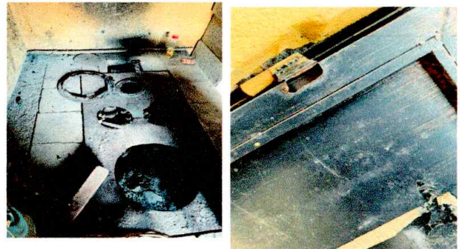
Foto 4: ES NECESARIO SUSTITUIR ORNILLA Y ESTUFA RURAL Y PUERTA EN MAL ESTADO