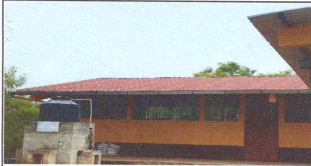
Foto1: Sustitución de cubierta de lámina.