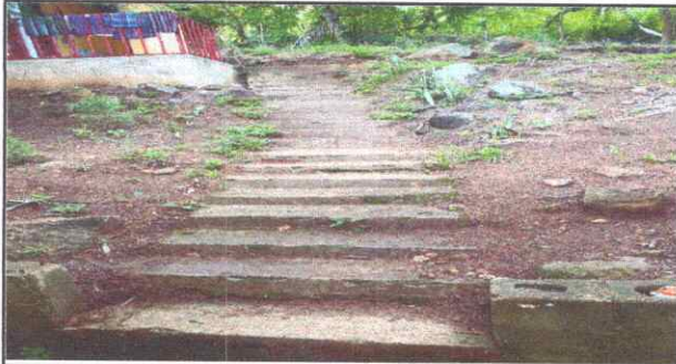
Foto 7: Mejoramiento de muro perimetral de gradas para ambos lados.