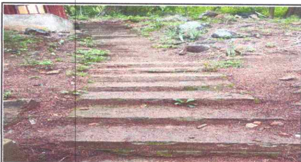
Foto 10: Colocación de gradas para seguridad de los alumnos hacia sanitarios.