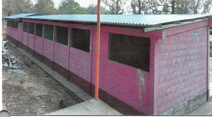
Foto 1: Cambio de duralita a lamina troquelada y costanera galvanizada