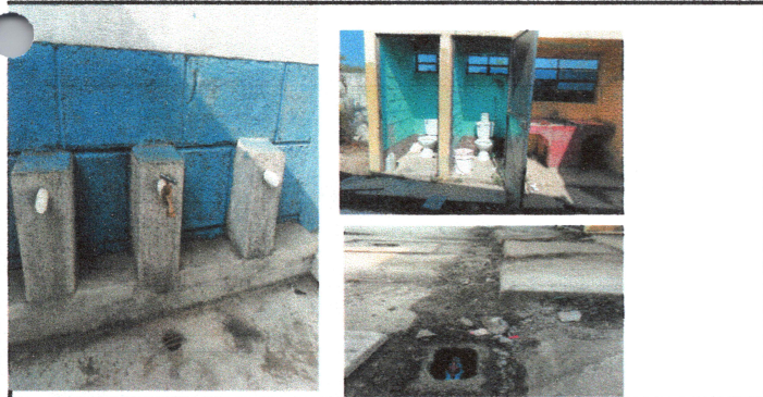
Foto 5: reparación de Instalacion de agua, y modulos de sanitario