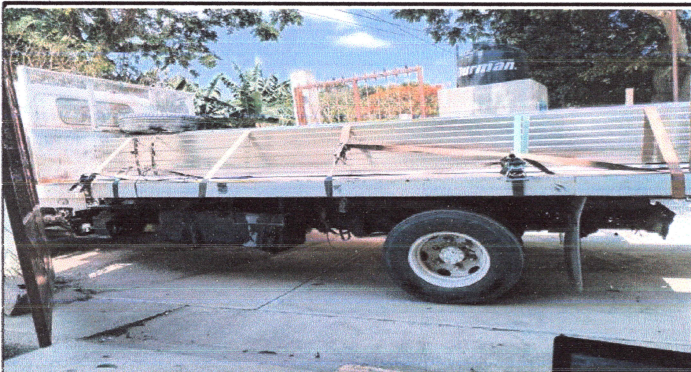
Foto 3: Recepción de costaneras y láminas para la sustitución de techo.