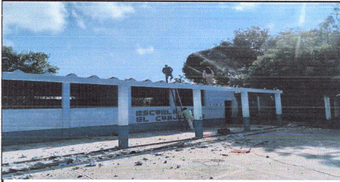
Foto1: Desmontaje de techo.