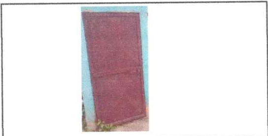
Foto1: SUSTITUCION DE PUERTA