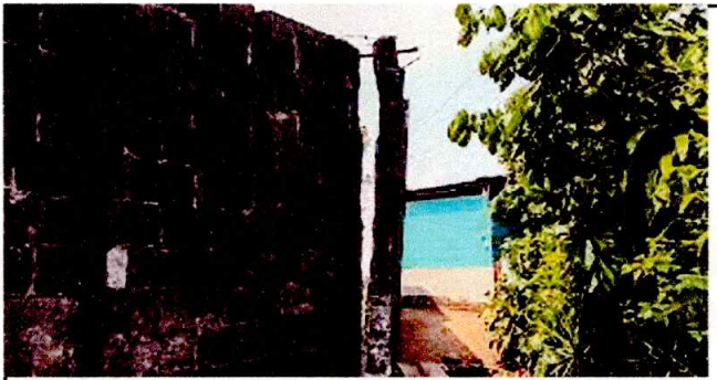
Foto 7: CERCA O MURO PERIMETRAL(SUSTITUCION DE MURO DE BLOK INCLUYE DEMOLICION, EXTRACCION DE MATERIAL DE DESPERDICIO)

Observación: Si es necesario se pueden agregar hojas adicionales y actualizar el número de hojas.