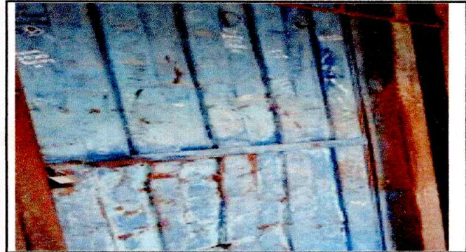
Foto 3: SE PUEDE OBSERVAR QUE LA PUERTA ES DE LAMINA Y ESTA EN MAL ESTADO LO QUE PROVOCA INSEGURIDAD EN EL AULA EDUCATIVA.