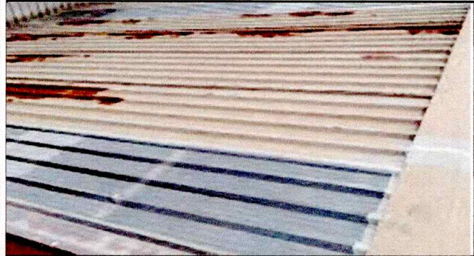
FOTO 1: SE PUEDE IDENTIFICAR EL MAS ESTADO DE LA LAMINA, SON MUY CORTAS POR LO QUE SE FILTRA EN AGUA.