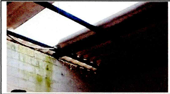
FOTO2: SE PUEDE OBSERVAR QUE LA ESTRUCTURA METALICA ESTA EN MAL ESTADO, ADEMAS MUY CORTA, LO QUE PROVOCA QUE SE FILTRE EL AGUA.