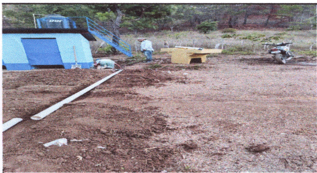
Foto: 5 Reparación de lavamanos, sistema de drenaje y agua potable.