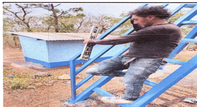
Foto: 6 Mantenimiento de depósito de agua.

Observación: Si es necesario se pueden agregar hojas adicionales y actualizar el número de hojas.