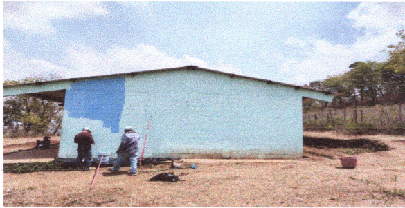
Foto1: Reparación de Pintura interior y exterior, sistema eléctrico, cuneta de concreto.