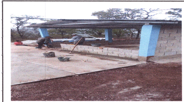
Foto4: Reparación de muros de cocina