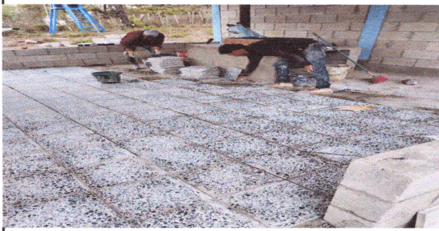
Foto3: Reparación de piso y sistema eléctrico