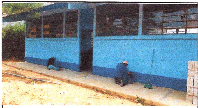
Foto4: Pintura en muros interior y exterior