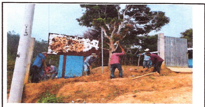
Foto: 6 mantenimiento a portones

Observación: Si es necesario se pueden agregar hojas adicionales y actualizar el número de hojas.