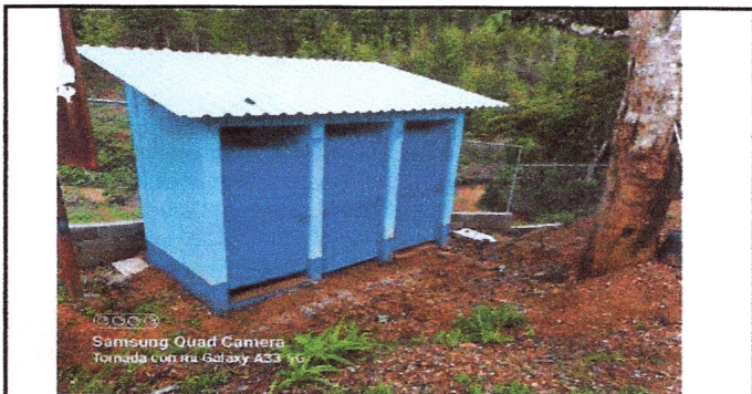
Foto: 5 Servicio sanitario y sus accesorios