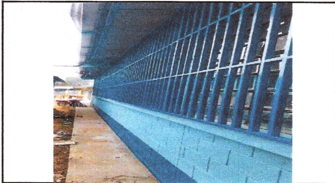
Foto3: Mantenimiento de balcones