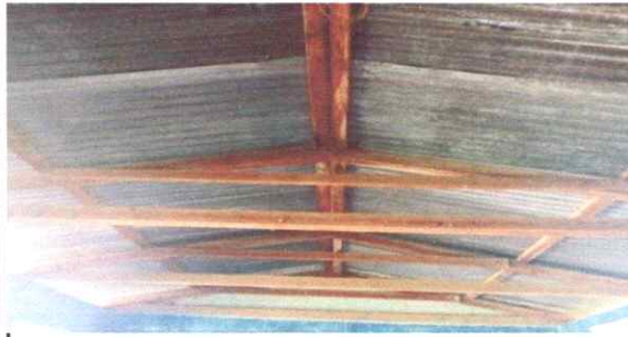
Foto1: CUBIERTA DE LAMINA