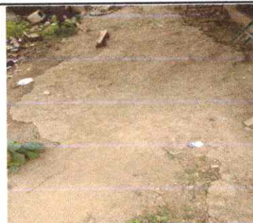
Foto 6: SUSTITUCIÓN LOSA DE PATIO INCLUY BASE, FUNDICION Y ACABADO

Observación: Si es necesario se pueden agregar hojas adicionales y actualizar el número de hojas.