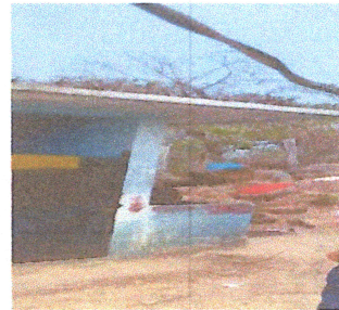
Foto4: reparacion de puertas 07-03-2024