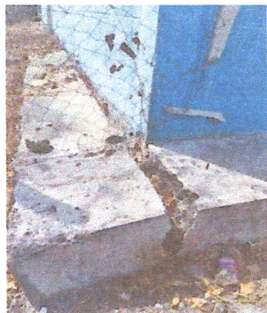
Foto: 5 reparación de canales y banqueta 07-03-2024