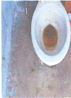
Foto3: reparacion del drenaje y baños 07-03-2024