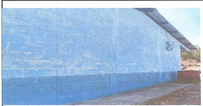
FOTO 2: pintura en muros interior y exterior 07-03-2024