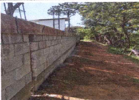
FOTO 5. Muro perimetral en el avance