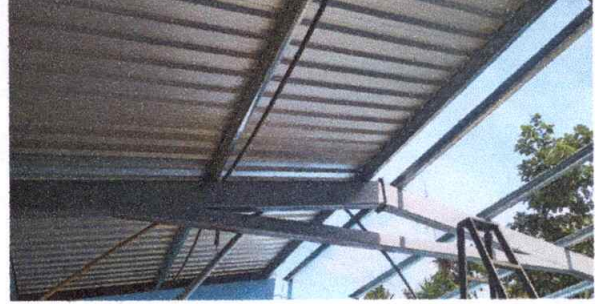
FOTO 2. Siguiendo con los trabajos de cubierta con la lamina