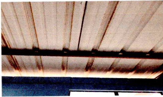
FOTO 1: SE APRECIA EL ESTADO DE LA CUBIERTA POR LO QUE ENTRA LA LLUVIA