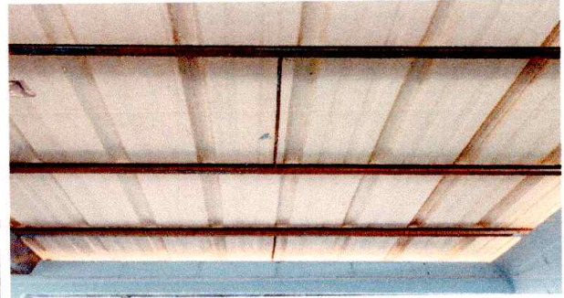
FOTO 2. EL MAL ESTADO DE LA LAMINA HACE CAER EL AGUA DENTRO DEL AULA