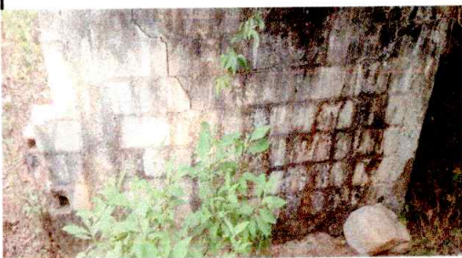
FOTO 5. MURO PERIMETRAL EN MAL ESTADO