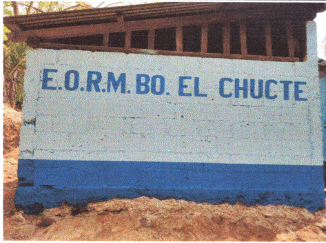
Foto1: En la entrada con el nombre del lugar