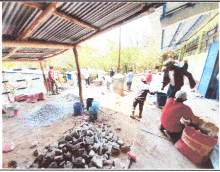
Foto 5: Padres de familia apoyando en la colocacio de la losa de patio