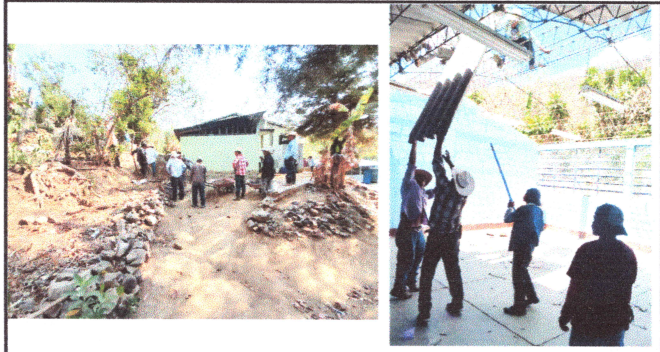
Foto1: Padres de familia apoyando en bajar el techo y rellenando con tierra.