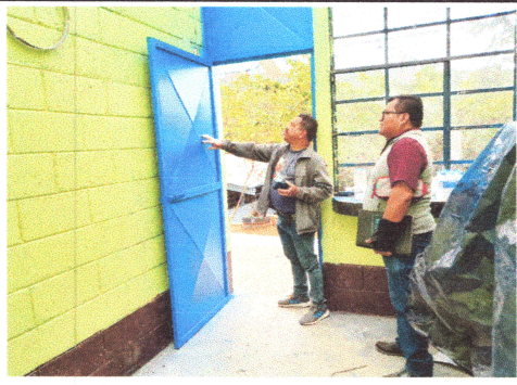
Foto 4: Visita de técnico de servicio de apoyo observando el trabajo.