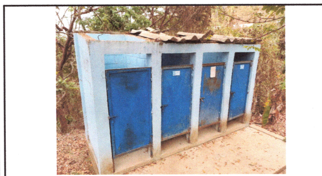
Foto3: reparacion de techo de baños y puerta