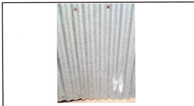
Foto4: Sustitucion de puerta