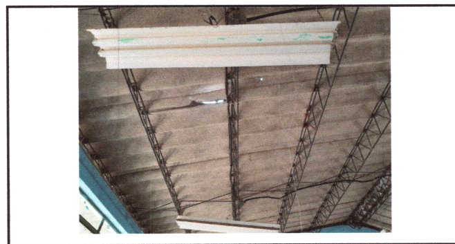
Foto: 6 Reparacion de sistema electrico

Observación: Si es necesario se pueden agregar hojas adicionales y actualizar el número de hojas.