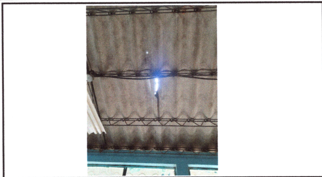
Foto1: Cambio de techo y reparacion de estrucra de techo