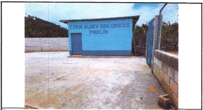
Foto: 6 Pintura de muros y exteriores

Observación: Si es necesario se pueden agregar hojas adicionales y actualizar el número de hojas.