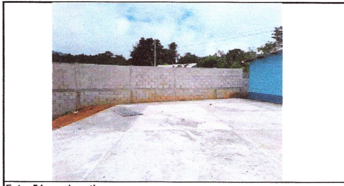
Foto: 5 Losa de patio