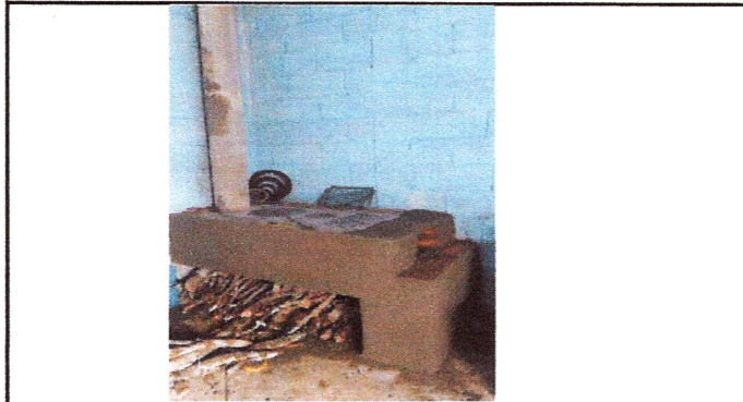
Foto3: Reparación de area de cocina