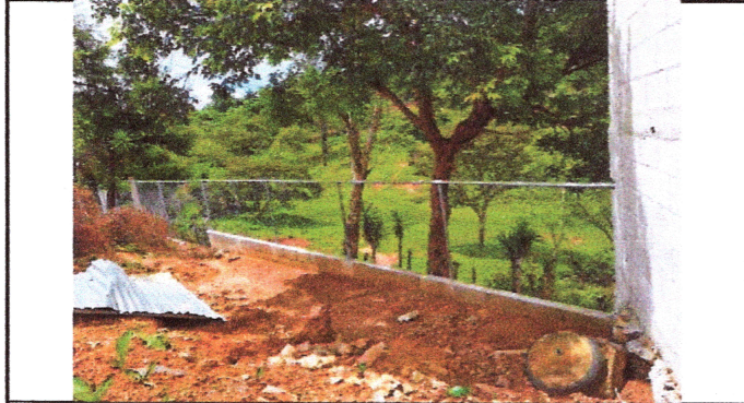
Foto1: Muro perimetral más malla