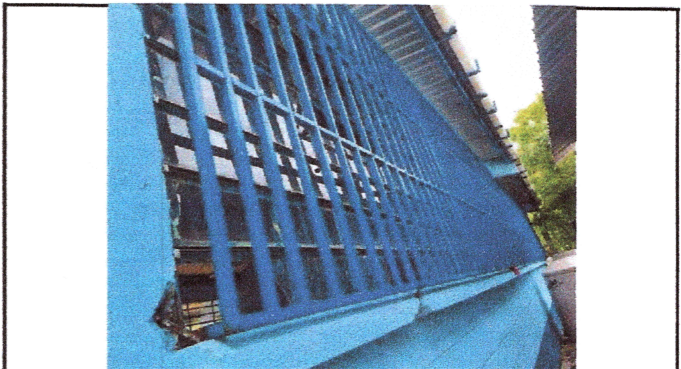
Foto4: Reparación de balcones