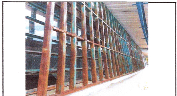
Foto4: Reparación de balcones