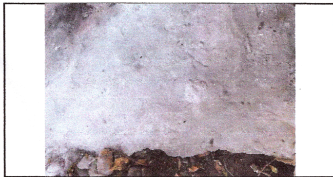
Foto: 5 Losa de patio