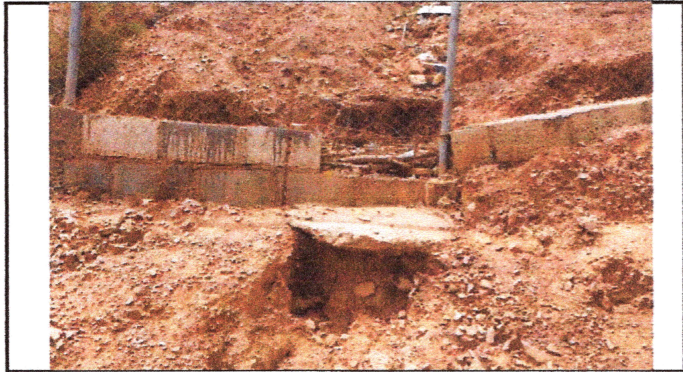
Foto1: Muro perimetral más malla