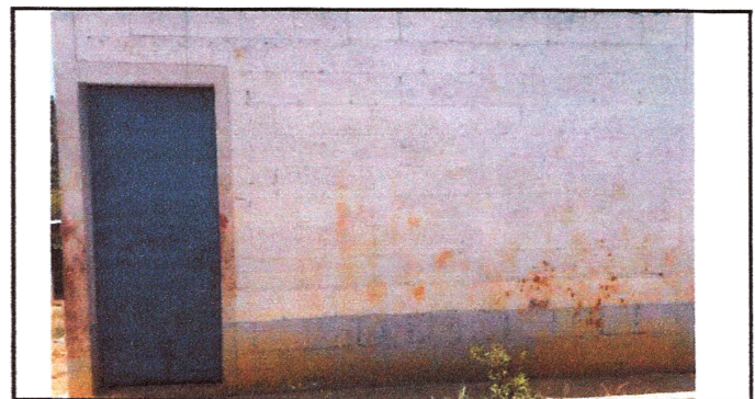
Foto: 6 Pintura de muros y exteriores

Observación: Si es necesario se pueden agregar hojas adicionales y actualizar el número de hojas.