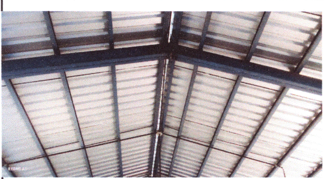
Foto1: Reemplazo de Lamina