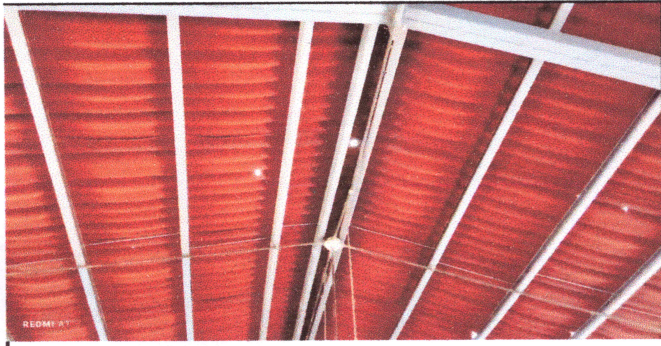
Foto1: REEMPLAZO LAMINA