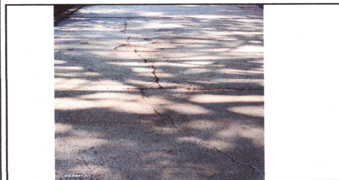
Foto: 5 REPARACION DE LOSA