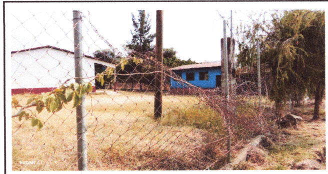
Foto4: CAMBIO DE MALLA EN MURO