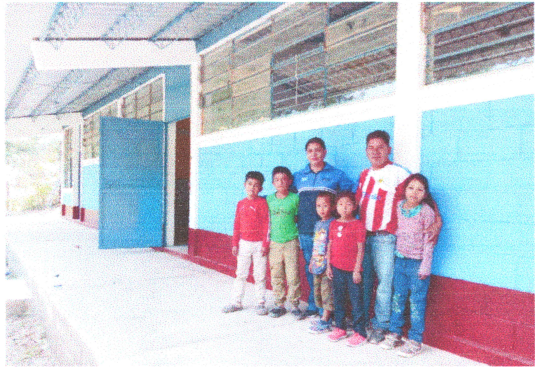
Foto 1: Techo finalizado, verificado por la Coordinadora Técnica Administrativa CTA