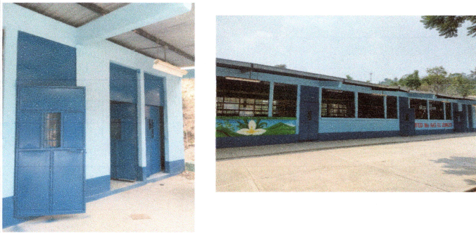
Foto 3: Se finalizó el mantenimiento de puertas de los sanitarios, salones y dirección