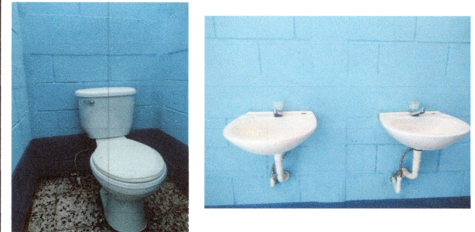
Foto 4: Se finalizó con la reparación de los servicios sanitarios de Hombres y Mujeres