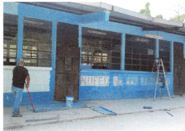
Foto1: Se pintaron muros interiores y exteriores