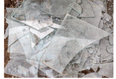
Foto 2: Se cambiaron vidrios en las ventanas del frente del centro