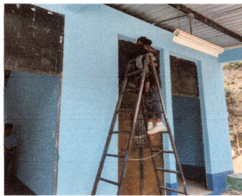
Foto 3: Se le dió mantenimiento alas puertas de los baños, salones y dirección