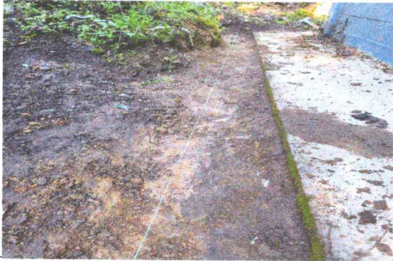
Foto1: Sustitucion de Cuneta de Concreto