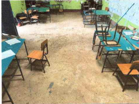
Foto1: RENGLO 1.1