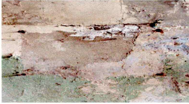
se requiere cambio de pintura nueva en el interior del aula.