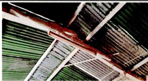
cambio de esreuctura y cubierta de lamina