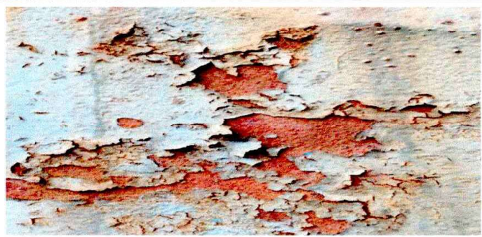
se requiere capa de pintura nueva en el exterior del aula.