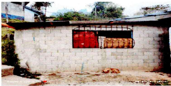
se requiere repello, cernido y pintura en el aula.

Observación: Si es necesario se pueden agregar hojas adicionales y actualizar el número de hojas.