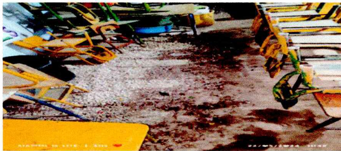
se requiere instalación de piso de granito